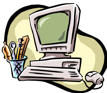
FIGURA 1 - Equipamento necessário a produção de monografia.

Dependendo do tamanho da ilustração, pode-se colocar diversas em uma única página, obedecendo à formalização individual para cada ilustração, como título, legenda, etc..